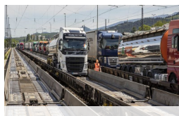
Precisazione sui beneficiari del ferrobonus