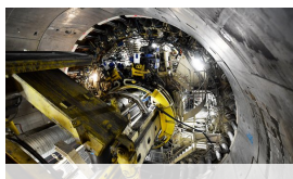
La Francia rischia di perdere i fondi UE per la Torino-Lione