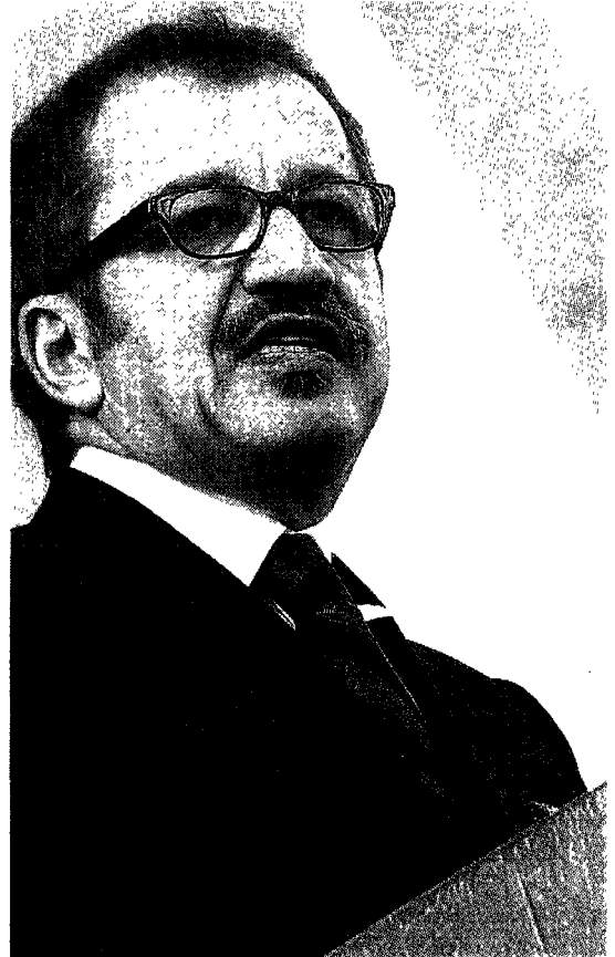
Viminale Il ministro dell'Interno Roberto Maroni

Oggi in Val di Susa, duemila poliziotti intervengono per rimuovere i posti di blocco dei comitati No Tav in modo che i cantieri possano aprire il 30 giugno, come richiesto dall'Unione europea e come annunciato dal ministro dell'Interno Roberto Maroni. Corriere.it , il sito internet del Corriere della Sera , seguirà gli sviluppi della situazione in Val di Susa con immagini esclusive di Corriere tv e con i servizi dei suoi inviati.