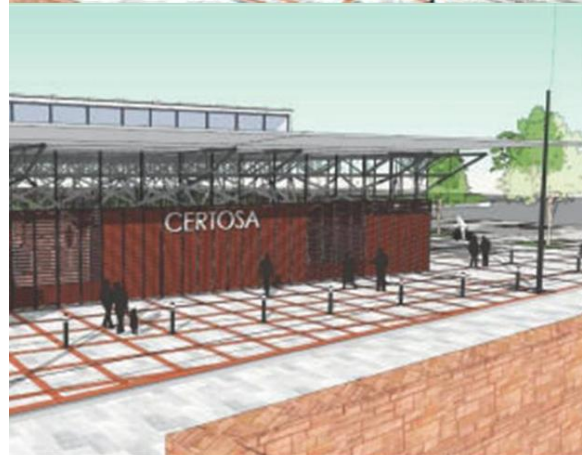
Il rendering della stazione di Collegno Certosa

La proprietà intellettuale è riconducibile alla fonte specificata in testa alla pagina. Il ritaglio stampa è da intendersi per uso privato