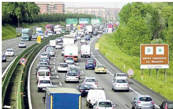
Anche la Tangenziale di Torino ha registrato un trend in crescita

Anche la Ativa, che ha in concessione la Torino-Ivrea e la tangenziale, registra una serie di incrementi. Pure in questo caso sui due percorsi il traffico pesante lievita maggiormente (più 3,3 per cento) rispetto a quello leggero (più 1,6). Per la tratta che abbraccia il capoluogo piemontese si parla di un incremento dell'1,6 per cento dei veicoli per chilometro, mentre l'autostrada canavesana cresce del 2,6 per cento. Tradotto, in numeri si parla di 81 milioni di veicoli (in questo caso il dato non è "per chilometro", a differenza dei precedenti) che sono transitati sulla tangenziale e di 14,5 mi-